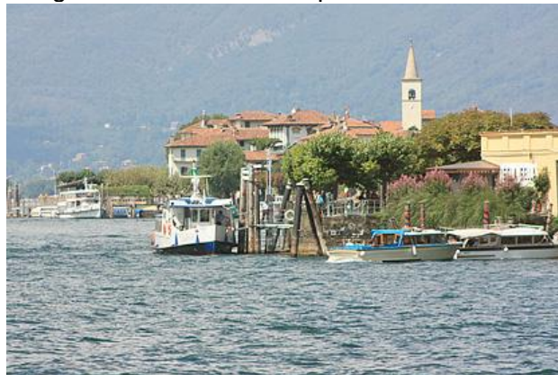
Blick vom Schiff auf die Isola Superiore dei Pescatori

bietet der Nationalpark Valle Grande zahlreiche Wanderwege. Reiseführer empfehlen Wanderungen durch unberührte Natur. Ab Cicogna bietet der Nationalpark Valle Grande zahlreiche Wanderwege. Die Auffahrt ist sehr schmal und steil, so dass sie nur bergerprobten Fahrern empfohlen werden kann, da man auf der Strecke wenden kann. Es kann passieren, dass empfohlene Rundwanderweg wegen Giftschlangen und Wildschweinen gesperrt sein können. Das Tessin und das Piemont haben neben den genannten noch viele weitere Sehenswürdigkeiten und Naturschönheiten.