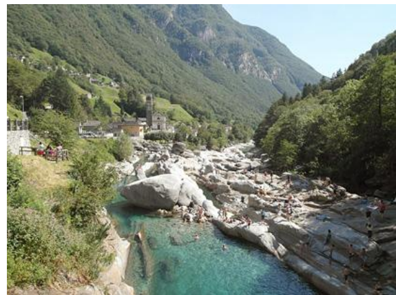
Das berühmteste Tal Europas: das Val Verzasca ob. Locarno und Ascona.

http://www.fahrrad-tour.de/LagoMaggiore/LagoMaggiore.htm